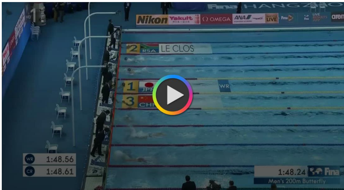
Svetovni rekord na 200 m delfin razkriva posebno zgodbo