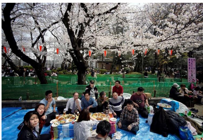
Piknik pod cvetočim češnjevim drevesom sredi tokijskega parka Ueno.

Vsako leto Japonci pozorno spremljajo napredek cvetenja. Med prvimi lahko v pojavu uživajo običajno na začetku marca na Okinavi, s toplejšim vremenom pa se fronta cvetenja češenj oz. sakura zensen pomika proti severu, ko v aprilu običajno zacvetijo češnje v Tokiu, v maju pa na severnem otoku Hokaido.