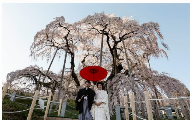
Japonska mladoporočenca pred fotogenično kuliso češnjevih cvetov.

Beli in rožnati cvetovi se s svojo lepoto in simbolizmom pogosto pojavljajo v japonski umetnosti. Naravni pojav je postal del kulturne identitete Japonske, državo pa v tem letnem času obišče več turistov kot kateri koli drug del leta.